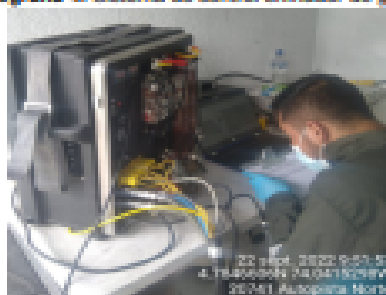
Fotografía 6. Operación de consola.