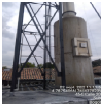
Fotografía 4. Sistema de control entrador de gases.