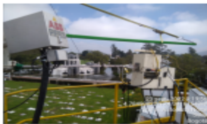
Fotografía 9. Operación de tren de muestreo 1.