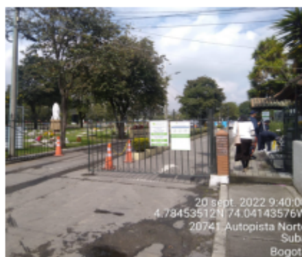
Fotografía 2. Ingreso del predio