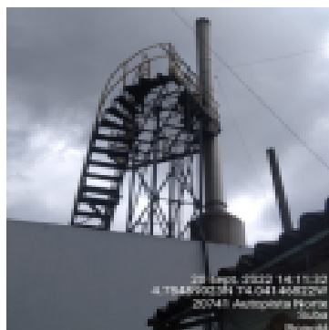
Fotografía 3. Ducto y plataforma Horno 2 IMAD.