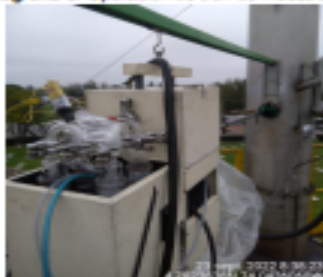
Fotografía 11. Operación de tren de muestreo 2.