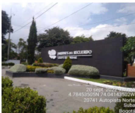
Fotografía 1. Fachada del predio

A continuación, se presenta el registro fotográfico de las actividades de toma de muestra llevadas a cabo en la fuente fija de proceso más combustión Horno 2 IMAD que opera con gas natural como combustible.