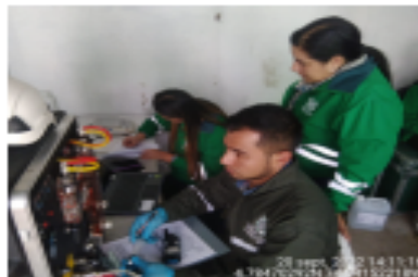
Fotografía 10. Personal de toma de muestras SDA.