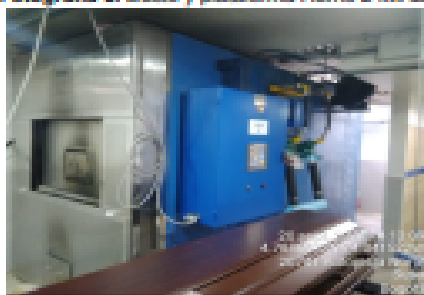
Fotografía 5. Horno 2 IMAD.