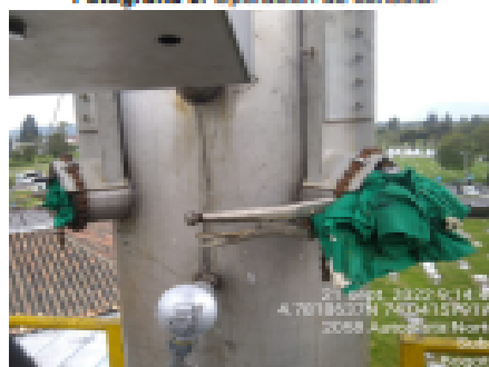
Fotografía 8. Puertos de toma de muestra.