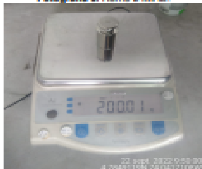
Fotografía 7. Verificación diaria balanza de campo.